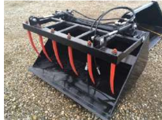
Skovl m overfald