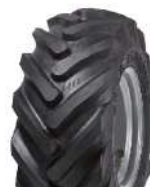
11,5 x 15 AS