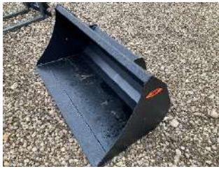
Skovl 150mm skær

Et udvalg af redskaber. Spørg om dit specifikke ønske